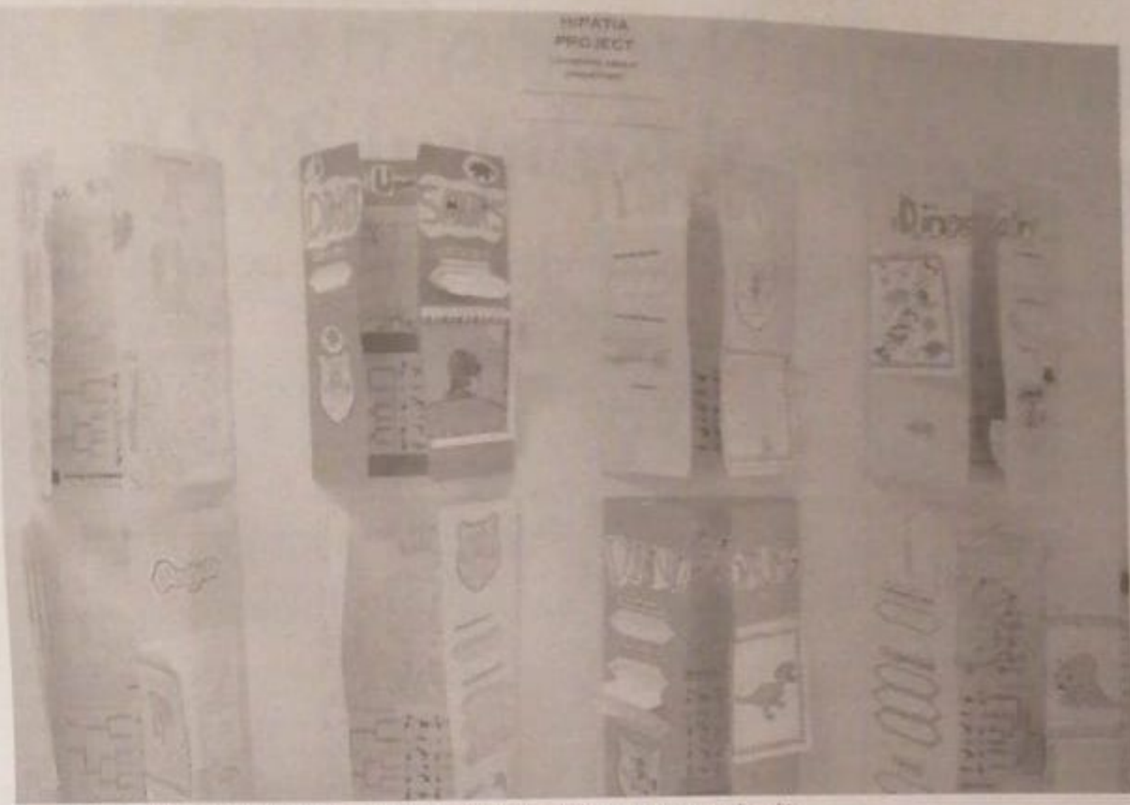
La experiencia del proyecto Hipatia compatibilizó el estudio de las ciencias con el inglés

Como anécdota, Royo explica que aunque los escolares turolenses tienen por lo general un conocimiento muy avanzado de los dinosaurios, persisten algunos mitos "como el del Indominus Rex, un dinosaurio ficticio producto de la genética en la saga cinematográfica Jurassic World, y que algunos piensan