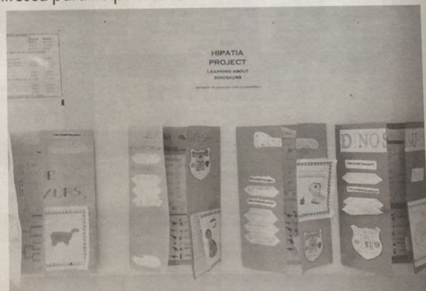
Algunos de los 'lapbooks' en inglés que realizaron los escolares turolenses en el contexto de la actividad de Hipatia

La unidad se desarrolló en tres sesiones que tuvieron lugar